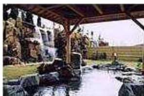
① 外湯 花ゆうみ