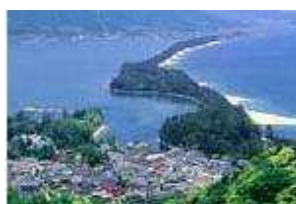
⑥ 日本三景 天橋立